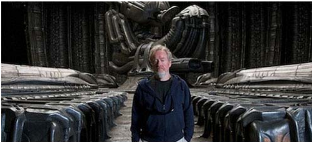
Top 10 : Ridley Scott

Il approche des 80 ans, et n'a sans doute jamais autant tourné : tout comme Clint Eastwood, Sir Ridley Scott est en train de s'offrir une fin de carrière royale, en enchaînant les tournages comme s'il venait de découvrir le cinématographe.