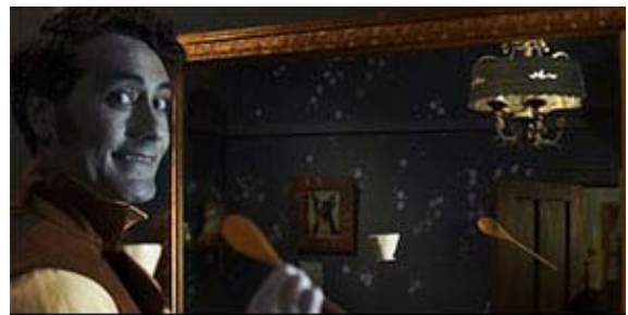
Vampires en toute intimité