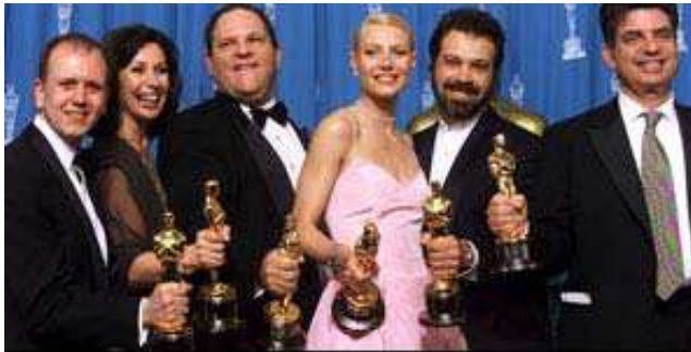
Top 10 : et l'Oscar n'aurait pas dû aller à...

Toute cérémonie de récompenses est subjective, bien entendu. Aucune n'a cependant le prestige et la longévité des Oscars, qui malgré les polémiques qui agitent cette édition 2016, reste si essentielle à l'industrie que la moitié du calendrier