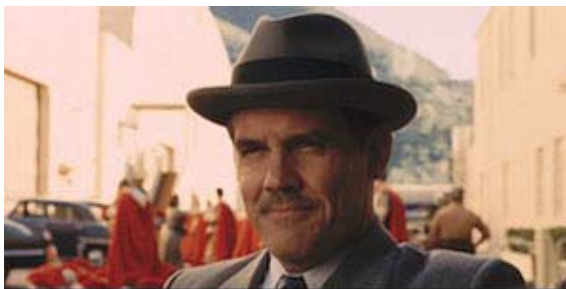
Ave Cesar !