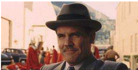
Ave Cesar !